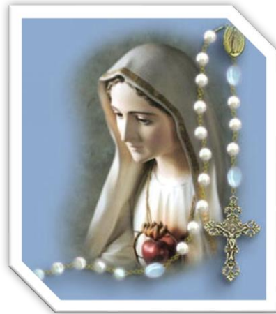
Kraljice krunice moli za nas!

Predragi: Podsjećam te: raspiruj milosni dar Božji koji je u tebi po polaganju mojih ruku. Jer nije nam Bog dao duha bojažljivosti, nego snage, ljubavi i razbora. Ne stidi se stoga svjedočanstva za Gospodina našega, ni mene, sužnja njegova. Nego zlopati se zajedno sa mnom za evanđelje, po snazi Božjoj.